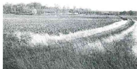
Utsikt från Lugnet mot Hallunda gård 1964. Detta var alltså nästan 10 år innan kedjehusområdet vid Bronsgjutarvägen kom till.