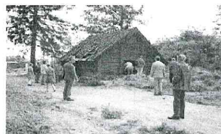
Lugnets smedja 1971. Den brann ned en natt 1977, vilket föranledde några kringboende att bilda föreningen "Rädda Lugnet", sedermera "Torpet Lugnet".

Det framgår av beslutsdokumentet för naturreservatet att de föreskrifter som utfärdats inte ska utgöra hinder mot skötsel och underhåll av torpet Lugnet och den