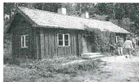
Torpet Lugnet 1971.